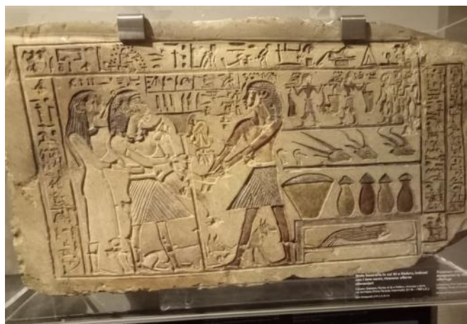
Stele funeraria di Iti e Neferu