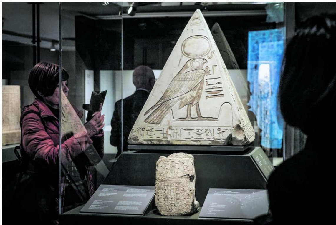
Pyramidion di Ramose (XIX Dinastia)