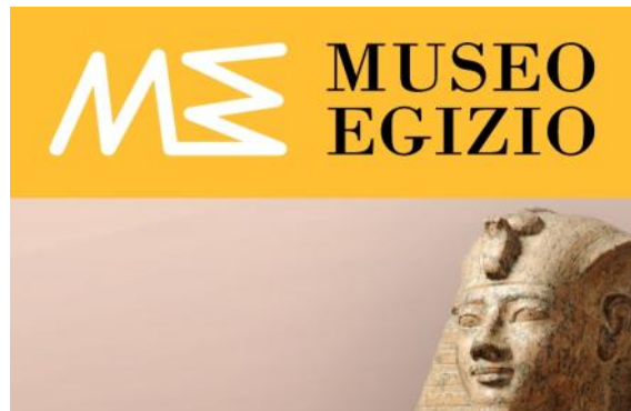
Bicentenario del Museo 1824 - 2024