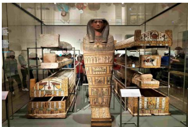
Sarcofagi di Tamit e delle sue due sorelle