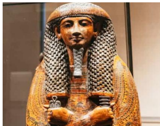
Sarcofago di Butehamon